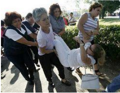
Photo : Les caméras du monde entier se sont déplacées pour immortaliser cette arrestation à Cuba d'une violence insupportable.

Les grèves de la faim et les suicides au nom d'une morale, d'une idéologie ou d'une croyance religieuse produisent généralement un effet sur les consciences. De Bobby Sands et des dix autres jeunes membres de l'IRA de l'Irlande du Nord qui sont morts dans les prisons britanniques en 1981, jusqu'aux nombreux cas de prisonniers politiques basques ou anarchistes qui protestaient au mois de janvier dernier contre les mauvais traitements et les manipulations par les autorités judiciaires et policières en Espagne et en France, les grèves de la faim et leur signification ont toujours été présentes sur les scènes politiques au cours des dernières décennies.